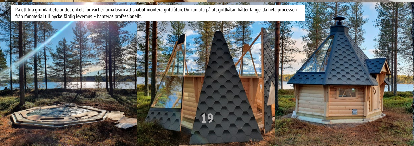
På ett bra grundarbete är det enkelt för vårt erfarna team att snabbt montera grillkåtan. Du kan lita på att grillkåtan håller länge, då hela processen - från råmaterial till nyckelfärdig leverans - hanteras professionellt.