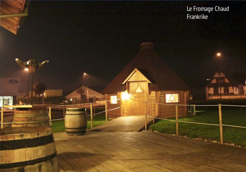
Le Fromage Chaud Frankrike