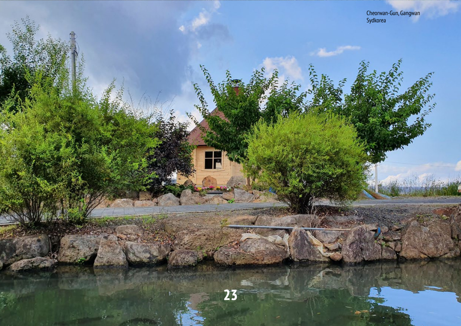
Cheorwan-Gun, Gangwan Sydkorea