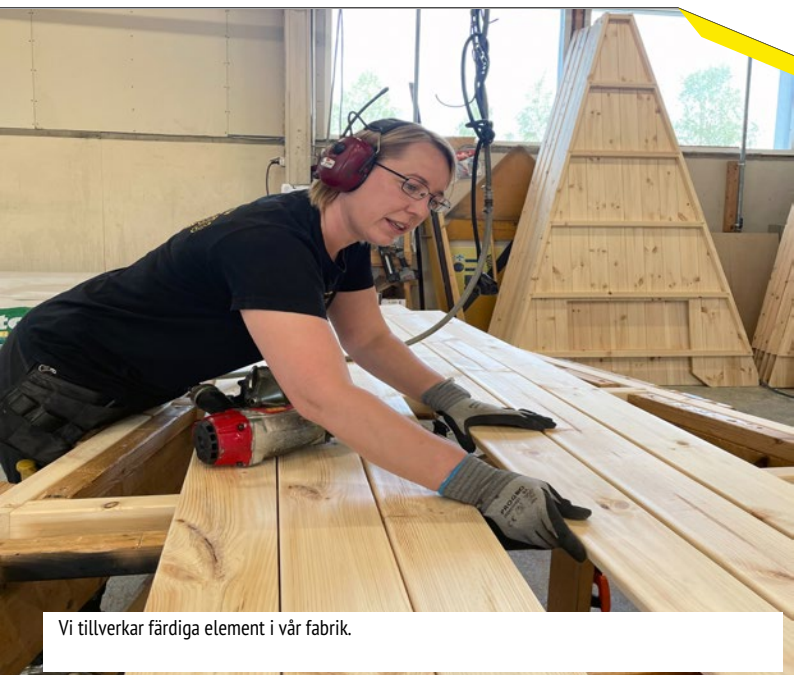
Vi tillverkar färdiga element i vår fabrik.

Leveransinnehållet kan ändras. Kontrollera alltid leveransinnehållet med din försäljare i samband med köpet.