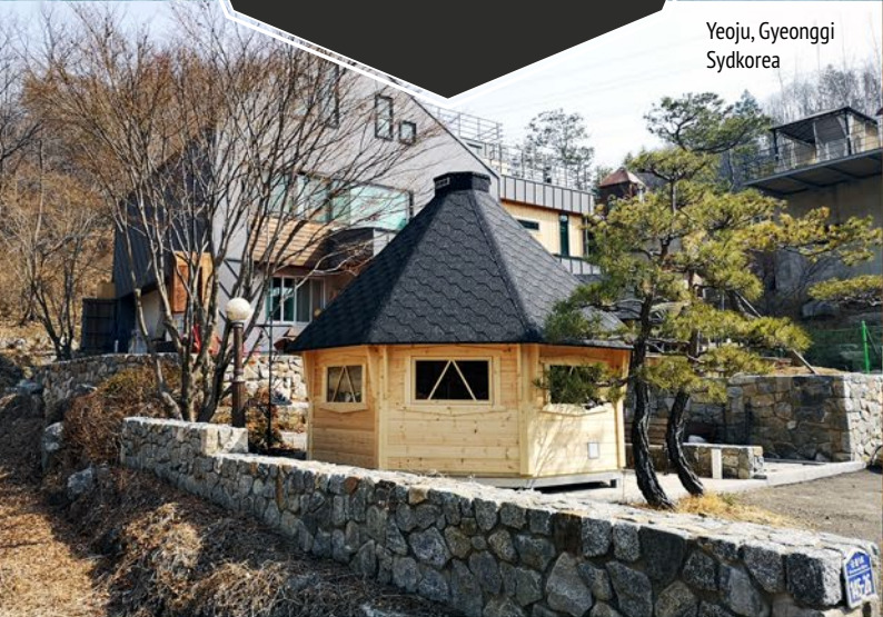
Yeoju, Gyeonggi Sydkorea