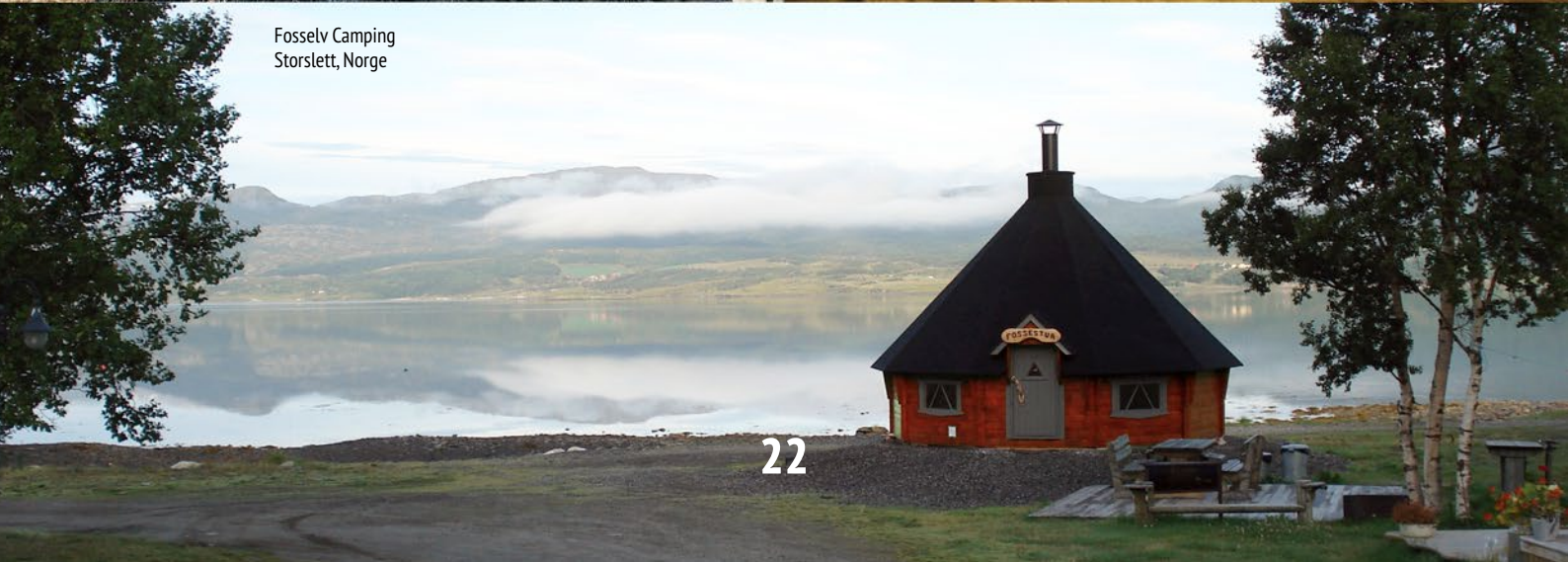
Fosselv Camping Storslett, Norge