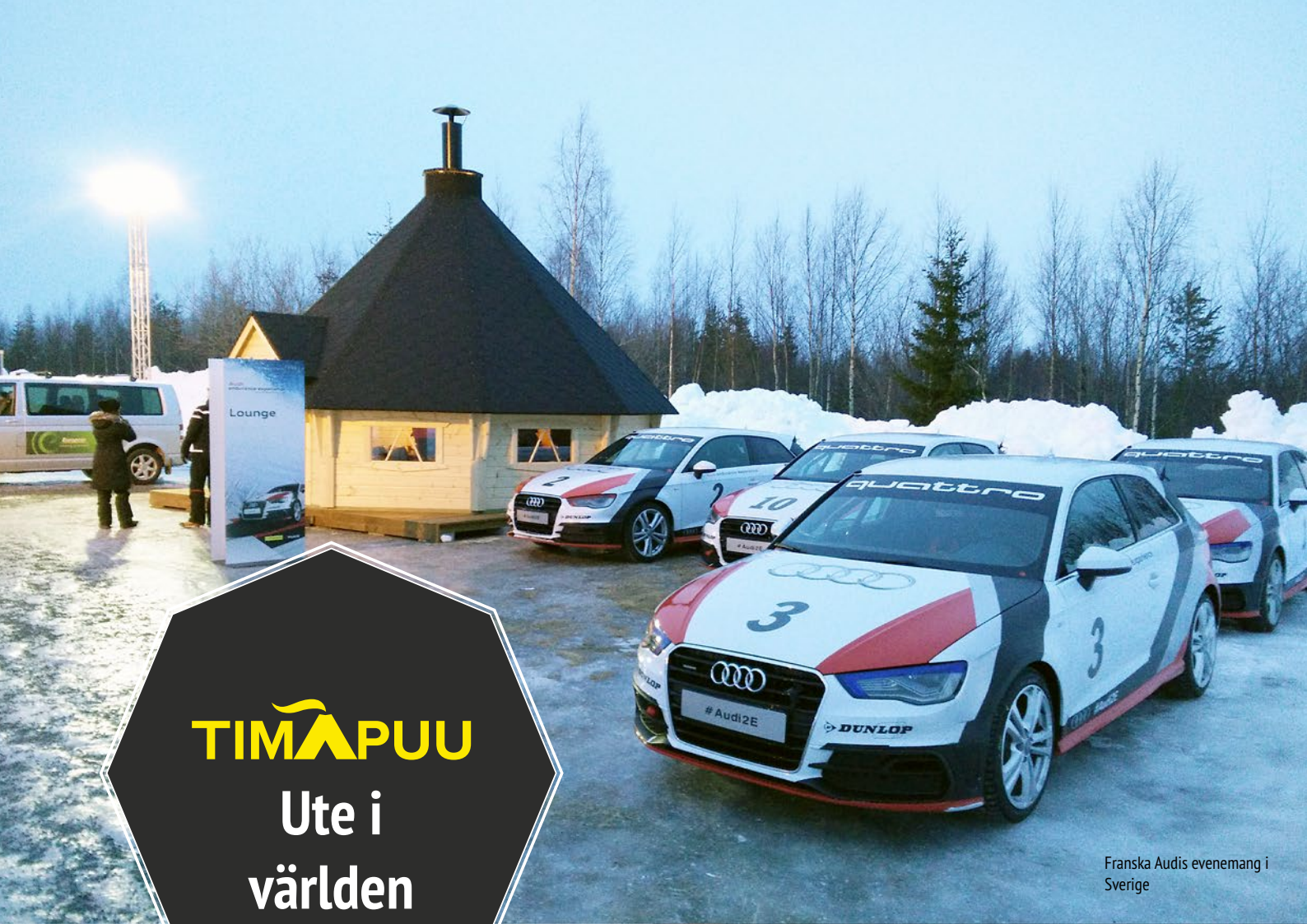
Franska Audis evenemang i Sverige