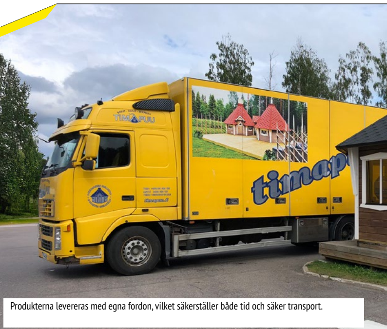
Produkterna levereras med egna fordon, vilket säkerställer både tid och säker transport.